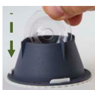
Sätt i doftbetet