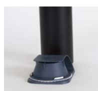
Placera ut fällan