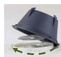
Lossa vid inspektion